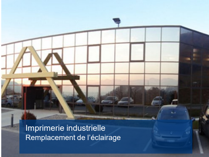
Imprimerie industrielle Remplacement de l'éclairage