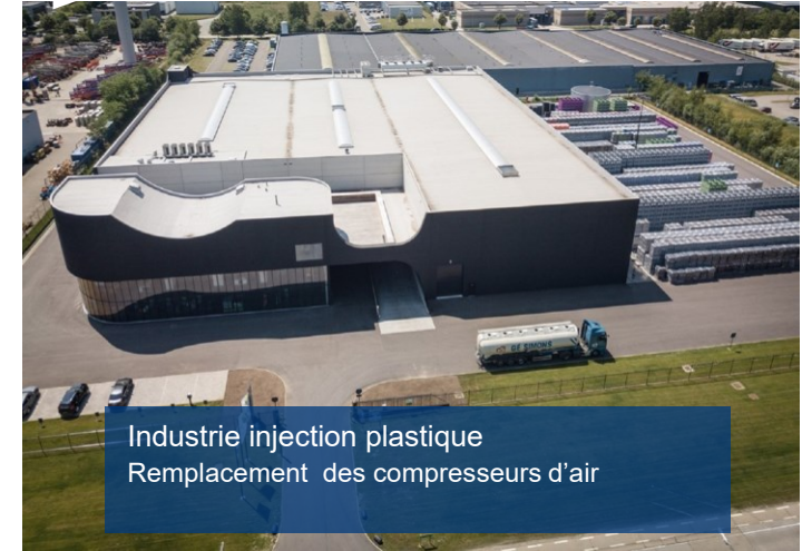
Industrie injection plastique Remplacement des compresseurs d'air

Le projet a permis d'atteindre les objectifs de réduction d'émissions de CO2 plus vite que prévu