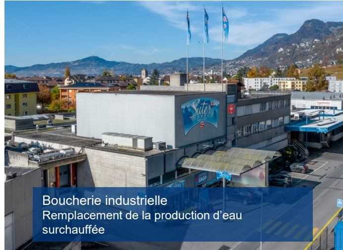
Boucherie industrielle Remplacement de la production d'eau surchauffée

Le projet a permis de dépasser les objectifs d'efficacité souhaités