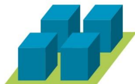
Siedlungen mit Mehrfamilienhäuser