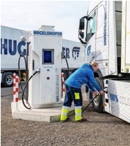
Ladekonzepte für Logistiker